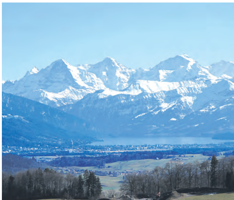
Fantastische Aussicht auf den Thunersee und die Alpen.

Ausgangspunkt ist Köniz. Auf der Schwarzenburgstrasse können wir uns nur kurz aufwärmen. Nach der Abzweigung Richtung Herzwil folgt schon der erste Anstieg. Da uns auf dieser Tour noch mehrere anstrengende «Bodenwellen» erwarten, ist es wichtig, dass wir unsere Kräfte am Anfang noch schonen. Die Weiler Herzwil und Liebewil, mit Gebäuden aus dem 16. und 17. Jahrhundert, gehören zum Inventar der schützenswerten Ortsbilder der Schweiz. Auf der